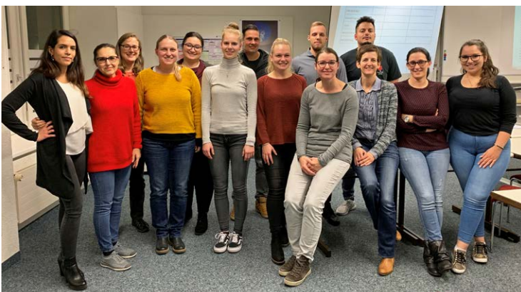
Start Sachbearbeiter Rechnungswesen