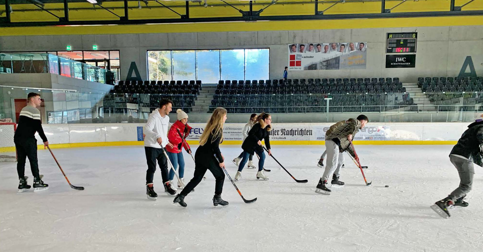
Die Klasse KVE 3f beim Eishockeyspiel