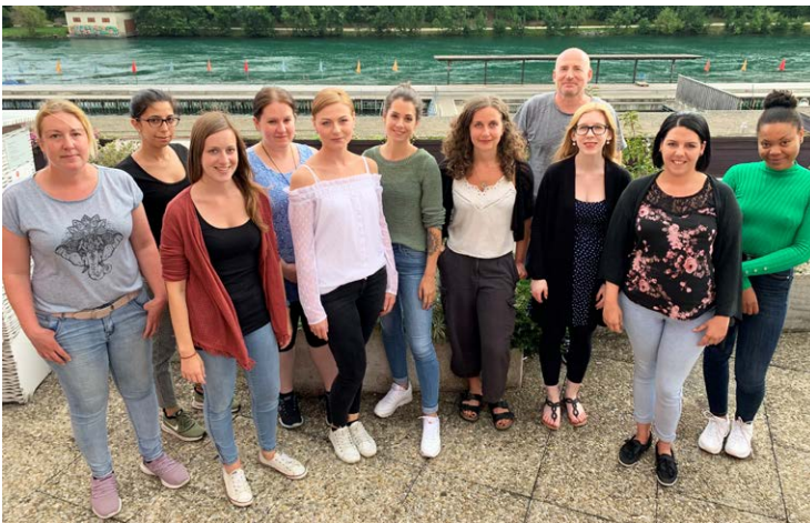
Klassenbild KV für Erwachsene