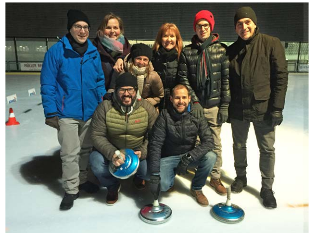
Projektmanagement Abschlussabend mit Eisstockschiessen