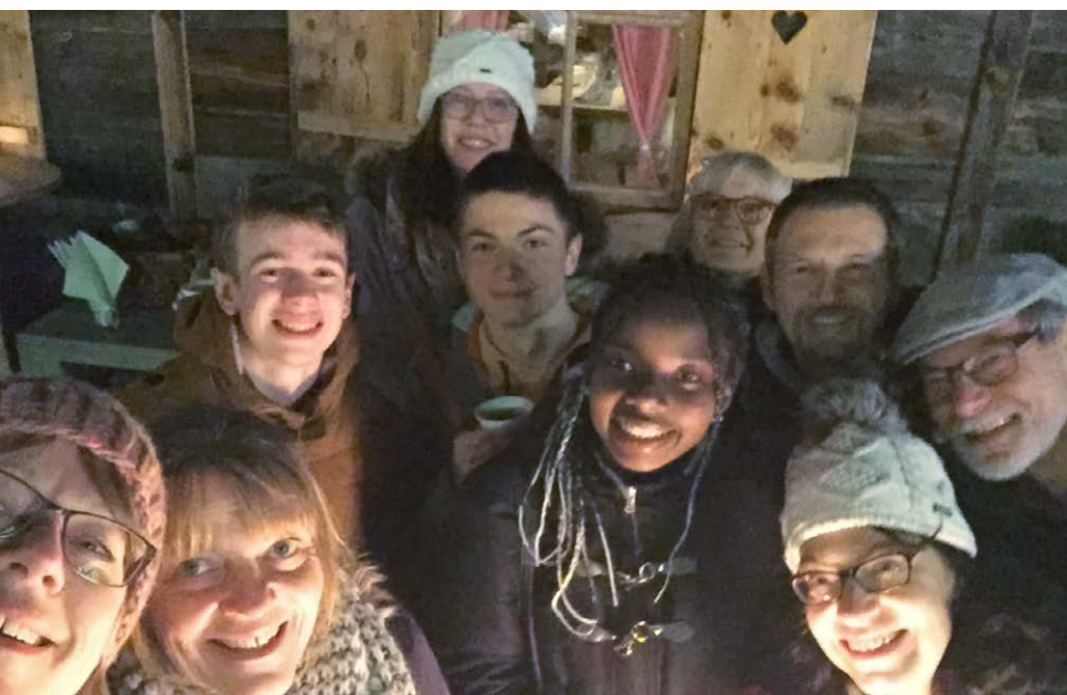
Teamanlass der Schulverwaltung beim Eisstockschiessen auf dem Herrenacker