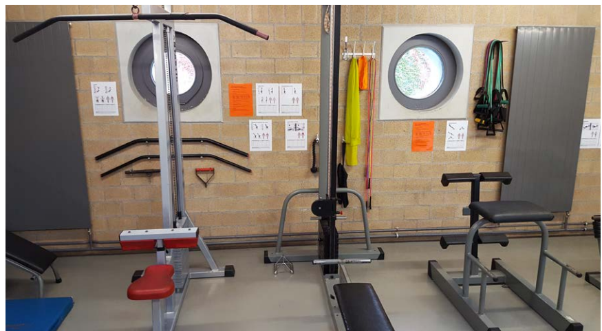
Der Krafraum in der Sporthalle Munot

Abschliessend ist der externe Sportunterricht anzusprechen. Die Lernenden treiben durchschnittlich einmal im Semester ausserhalb der Sportanlage Munot Sport. So wird beispielsweise in der Aranea geklettert, in den KSS Freizeitsportanlagen je nach Jahreszeit Beachvolleyball oder Eishockey gespielt, Schlittschuh gelaufen oder geschwommen und im Eurofit trainiert. ■