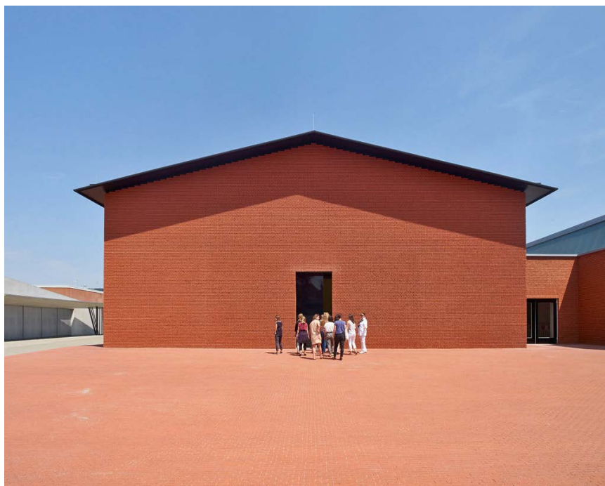
Das Vitra Schaudepot, konzipiert von Herzog & de Meuron

Anschliessend ging die Reise weiter in Richtung Saig-Lenzkirch, wo wir wiederum sehr gastfreundlich und echt schwarzwälderisch empfangen wur-