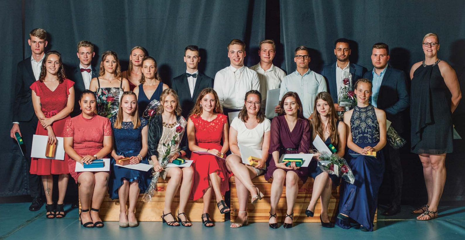
Die Rangkandidatinnen und -kandidaten mit einer Gesamtnote von 5.3 und höher erhalten eine Anerkennungsurkunde.