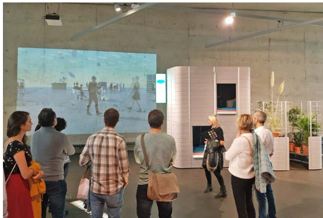
Das Kollegium auf dem Rundgang im Vitra-Design-Museum