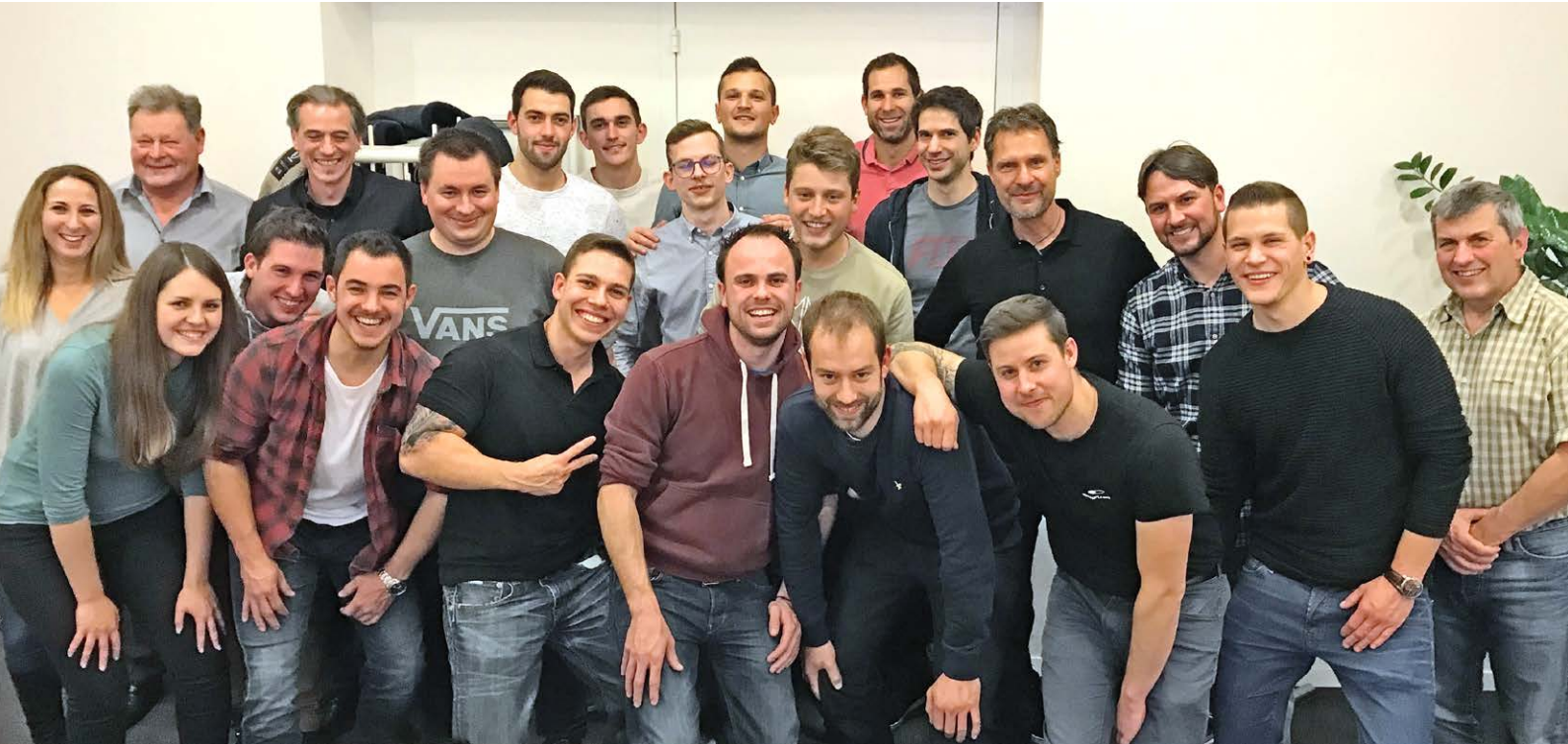
Abschlussfeier Technische Kaufleute